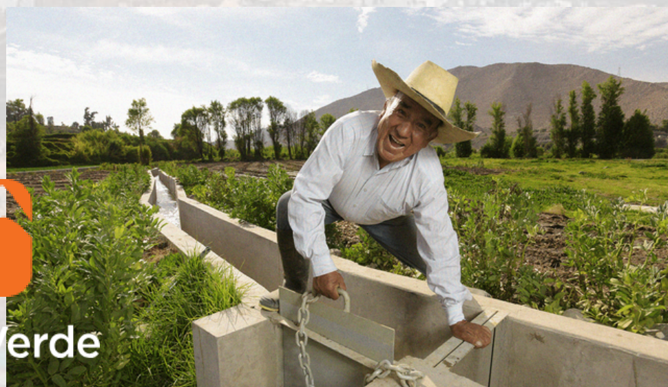
Infraestructura de riego: Cultivos de vid y palta para exportación