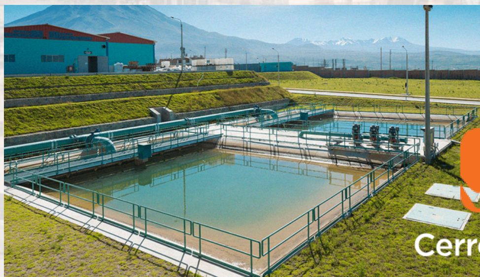
Planta de Tratamiento Miguel de la Cuba

La relevancia del sector minero se visibiliza en inversión para la región. Ejemplos de ello, entre otros, son las Represas de Bamputañe, Pillones y San José de Uzuña co-financiadas por Cerro Verde S.A.A. (líder en la producción de Cu y Mo 2023)